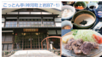
こっとな亭(神戸町上岩87-1)