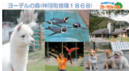
ヨーデルの森(神戸町猪俣1868)