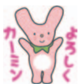
神河町マスコットキャラクター カミン