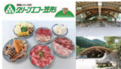
グリーンエコー笠形(神戸町根宇野1019-13)