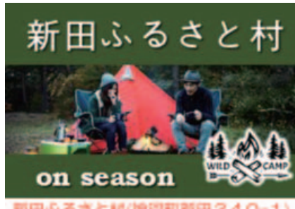
新田ふるさと村(神戸町新田340-1)