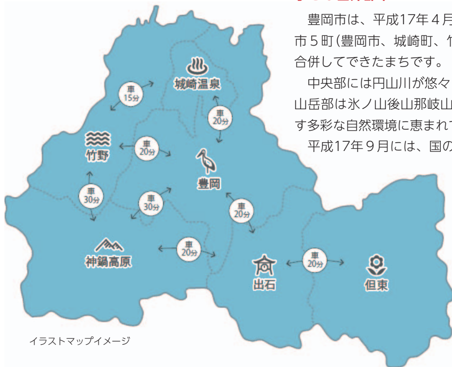
イラストマップイメージ

平成17年9月には、国の特別天然記念物・コウノトリが放鳥され、平成19年7月には、国内の自然界では46年ぶりにひなが巣立つなど、人里で野生復帰を目指す世界的にも例がない壮大な取組みが着実に進んでおり、現在では200羽を超えています。