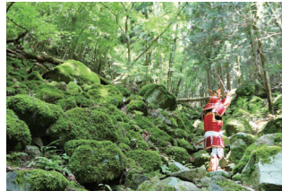
落ちない城・白旗城

毎年7月下旬には、“川の都”かみごおり川まつりを開催し、千種川周辺で水上運動会や水鉄砲を使い相手のゼッケンについた的を狙うウォーターファイト、川魚のチチコを釣るチチコ釣り大会など、子どもが楽しめるイベントを多数行います。祭りのフィナーレには、千種川中州から花火を打ち上げ、色鮮やかな花火が千種川を照らし、幻想的な風景を見ることができます。