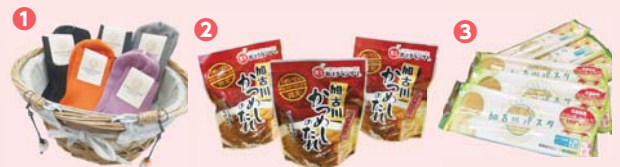
写真はいずれもイメージ