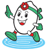
稲美町イメージキャラクター「いなみっちゃん」

が、隣接の4市に囲まれた地理的条件から、基幹産業の農業のほか、住宅地や工業用地としても開発が進んでいます。また特産品「いなみ野メロン」や「万葉の香（コシヒカリ米）」に代表される町内の優良な農産物や加工品などを「稲美ブランド」として認証し、産業振興にも取り組んでいます。