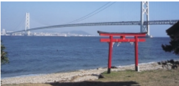
表紙の写真の説明

※詳しくは淡路市観光協会ホームページ http://www.awajishi-kanko.com/ 淡路市観光案内所 0799-75-2119 (案内業務時間 9:00～17:00)