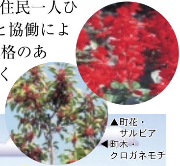
▲町花・サルビア ▲町木・クロガネモチ

現在の福崎町は昭和31年5月3日、田原村、八千種村、福崎町の1町2村が合併し誕生しました。平成18年には町制50周年を迎え、1年を通じた様々なイベントで福崎町の魅力を再確認しました。これからも豊かな自然や歴史、3つの工業団地、4年制大学など多彩なまちの資源を活用しながら、住民一人ひとりを大切に、参画と協働により「活力にあふれ 風格のある 住みよいまち」づくりを進めていきます。