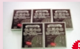
但馬牛のビーフカレー