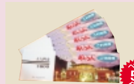
温泉保養館おじろん入浴利用券