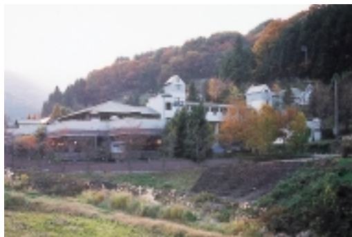
純天然温泉が人気の温泉保養館おじろん

大浴場の他に三種類の薬湯、露天風呂、うたせ湯などがあり、のんびり森林浴と湯三昧のリラクゼーションを楽しむことができます。また、スキーやキャンプなどを楽しんだ後の、憩いのスペースとしても気軽に利用することができます。