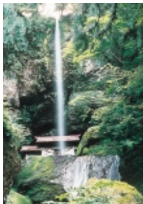
滝を裏側から見る事ができる名勝「吉滝」