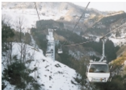
ゴンドラステーションからゲレンデまでを約6分で結ぶ美方町ゴンドラリフト

ゴンドラ搬器は8人乗りで、雪や風にさらされず便利で安全にゲレンデに到着することから、スキーヤーや家族連れから好評を得ています。