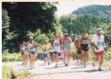
標高差700mの過酷なコースを駆け抜ける「みかた残酷マラソン」全国大会