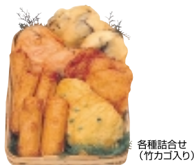
※各種詰合せ（竹カゴ入り）

尼崎で古くから続く老舗のひとつ「枳千」は、安政年間（1854～1860）創業で現在8代目となります。人口甘味料ではなく、砂糖を使って焼き上げたきつね色の白天は「白くない白天は枳千だけ。」という全国から注文が集まる人気のメニューです。