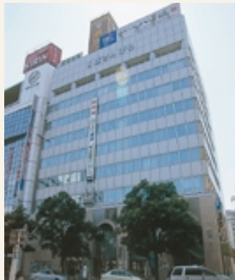
(財)西播地域地場産業振興センター