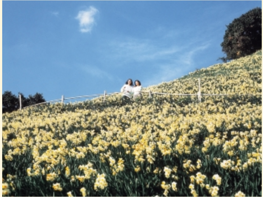
7ヘクタールの斜面に500万本!まるで白い花のじゅうたん

南淡町データ 人口/19,830人 (H15.12.1現在) 面積/86.92km 2