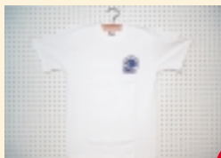
植村直己冒険館Tシャツ(1枚)