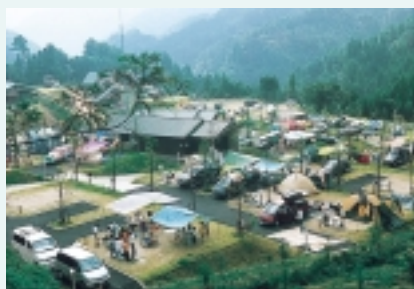
湯の原温泉オートキャンプ場