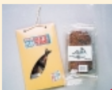
溶岩ジャンボ虹ますの甘露煮(1セット)

●全当選者に「植村直己冒険館」と「かなべ湯の森ゆとりろぎ」ペア招待券をプレゼント