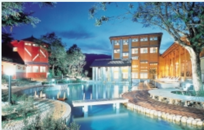
かなべ湯の森ゆとろぎ