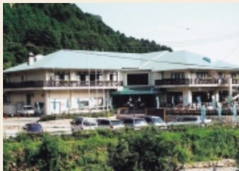
リフレッシュパーク市川 どんぐりころころ館