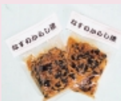
なすのからし漬 (3袋)