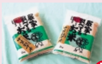
農家の食べてるお米 (2kg)