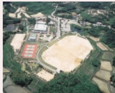
総合中央活動センター全景

吉川町のスポーツの拠点として多目的グラウンド、テニスコート、ゲートボール場、アスレチックコースを備えます。また、文化体育館（パストラル・ホール）ではコンサートやバレーボールの公式試合ができます。センター中央にあるカリヨン広場ではカリヨンの鐘の音と四季折々に彩られる花時計が心を癒します。